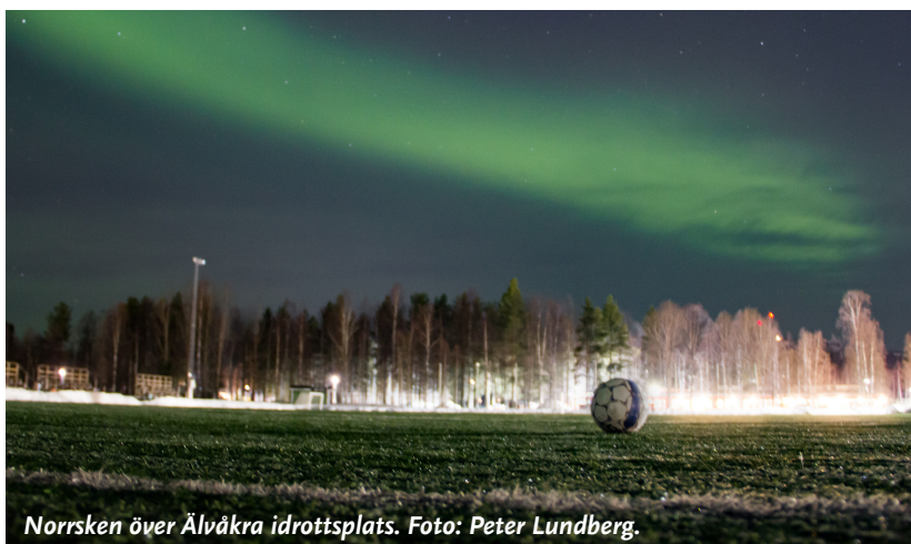
Norrskan över Älvåkra idrottsplats.

En ny prognos från migrationsverket visar att antalet asylsökande blir färre men att kommunmottagandet av nyanlända med uppehållstillstånd ökar under 2016 och 2017. Den nya aprilprognosen för asylmottagandet under år 2016 har minskat jämfört med Migrationsverkets prognos från februari. Mellan 40 000 och 100 000 asylsökande beräknas komma till Sverige i år varav 4 000 till 14 000 är ensamkommande barn. Planeringsscenariot är 60 000 asylsökande varav 7 000 är ensamkommande barn. Det innebär att antalet asylsökande ökar under andra halvåret men i betydligt mindre omfattning än under hösten 2015. Trots att höstens akuta situation i mottagningssystemet har förbättrats under våren kommer effekterna från hösten 2015 att påverka asylsystemet under flera år framöver. Migrationsverket har just nu 170 000 personer inskrivna, varav drygt 140 000 väntar på ett beslut i sitt asylärende, och de behöver sina dagliga behov tillgodosedda under tiden som deras asylärenden prövas.