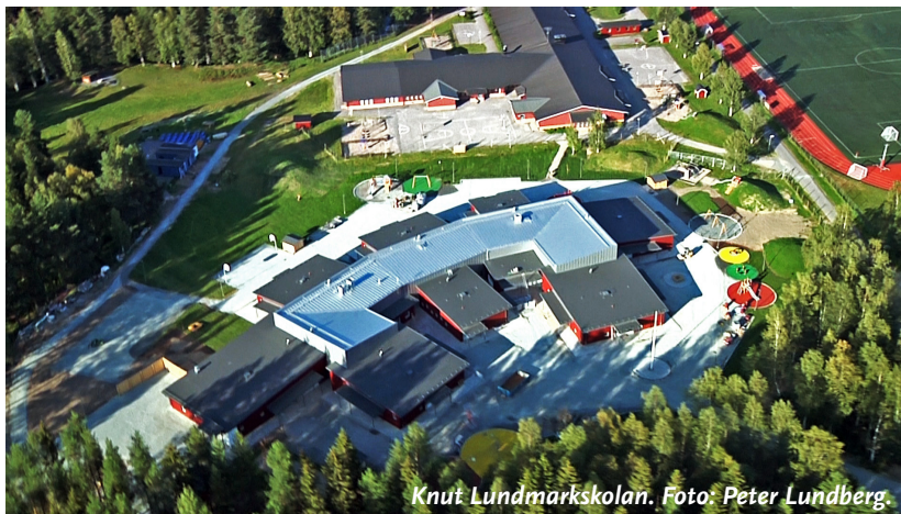
Knut Lundmarkskolan.