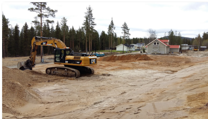
Villabygge på de nya tomterna på Prästgården.