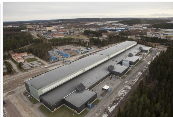
Datacenter i Luleå.