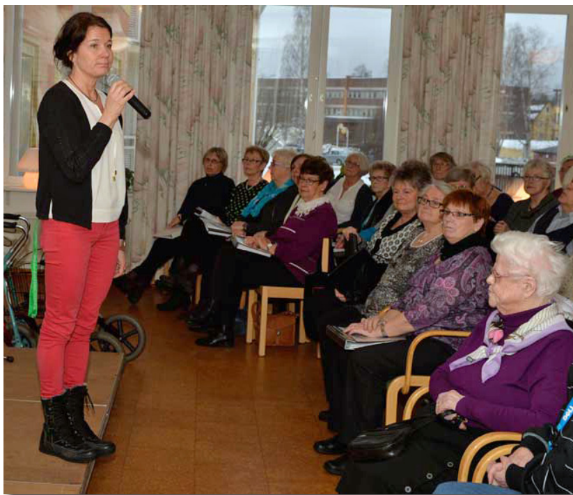
Intresset för äldre- och anhörigveckan fortsätter att öka.

mensam chef. När dessa förändringar är genomförda och de tillfälliga särskilda boendeplatserna är klara kommer vi att kunna påbörja det viktiga arbetet med att stärka kvarboendet.